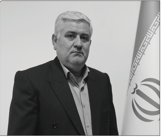
مدیرعامل شرکت گاز استان اردبیل: ۹۸ درصد روستایان اردبیل از گاز طبیعی برخوردارند صفحه ۲