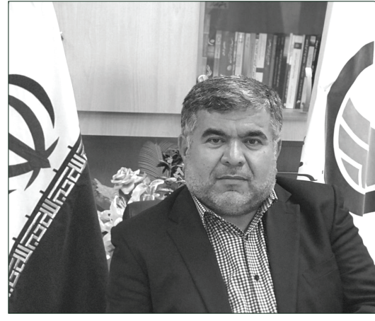
مدیرعامل شرکت آب و فاضلاب استان اردبیل: پروژه فاضلاب شهر نیر تا ۲ ماه آینده به بهره‌برداری می‌رسد صفحه ۴