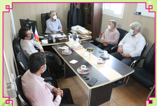
جلسه هم اندیشی روابط عمومی آبفا فارس و روابط عمومی آموزش و پرورش استان