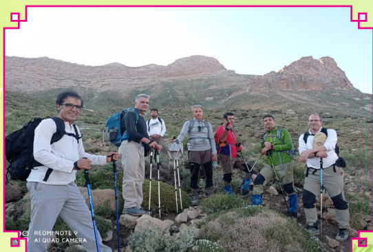
صعود تیم کوهنوردی شرکت آبفا فارس به بلندی های سپیدان